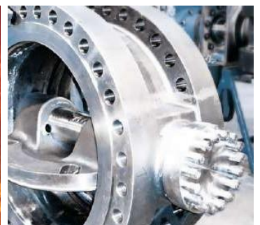
DÁMPERS Y VÁLVULAS