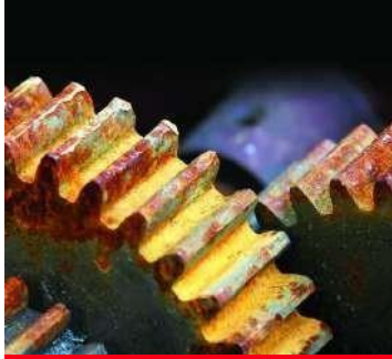
CONTROL DE CORROSIÓN