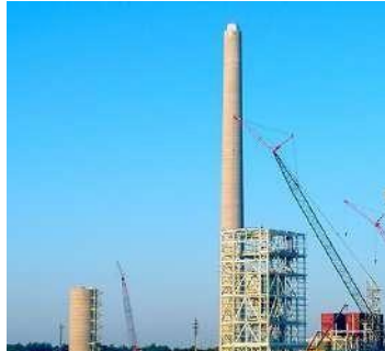
PIPING/ DUCTOS/ CHIMENEAS