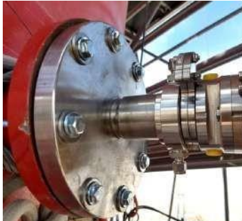
LIMPIEZA DE GASES