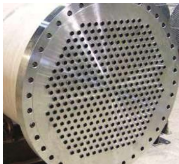
EQUIPOS DE TRANSFERENCIA DE CALOR